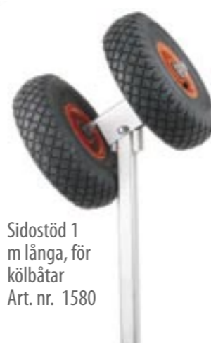
Sidostöd 1 m långa, för kölbåtar Art. nr. 1580