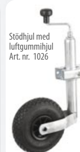
Stödhjul med luftgummihjul Art. nr. 1026