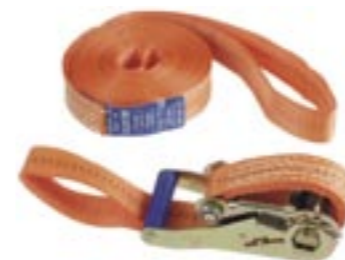
Praktisk surrningsvinsch med ögla i bandet. Längd 6 m, surrningsstyrka 5 ton Art. nr. 1321

Utrusta din båtvagn med kvalitetstillbehör - För fler tillbehör besök WWW.TRAILERSHOP.SE