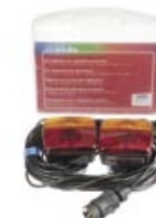
Magnetlampsats - Art. nr. 1549