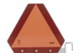
LGF-skylt med fäste - Art. nr. 1575