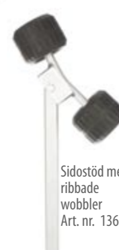
Sidostöd med ribbade wobbler Art. nr. 1362