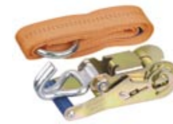
Praktisk surrningsvinsch med stålögla för knapen. Längd 2 m, brottstyrka 2,5 ton Art. nr. 1177