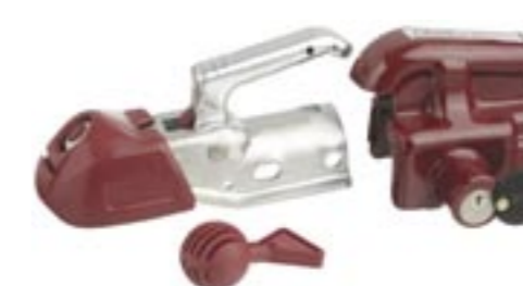
AL-KO Safety paket Godkänt av SSF och försäkringsbolagen Art. nr. 1425