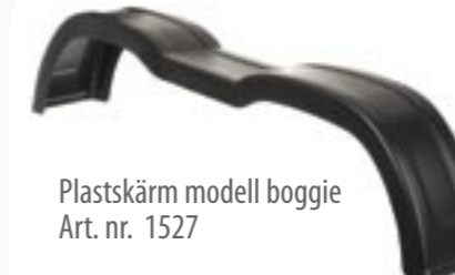
Plastskärm modell boggie Art. nr. 1527