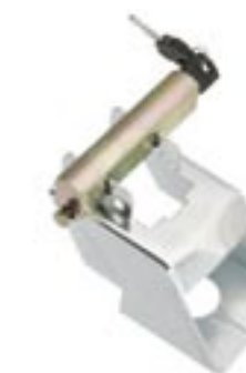
Trailerlås, Heavy Duty - Art. nr. 1535