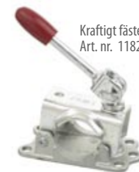
Kraftigt fäste för stödhjul Art. nr. 1182