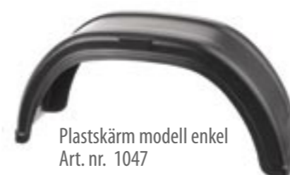
Plastskärm modell enkel Art. nr. 1047