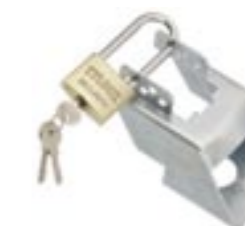
Trailerlås, långt hänslås - Art. nr. 1350