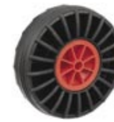
Sidostödhjul i hård gummi Art. nr. 1518